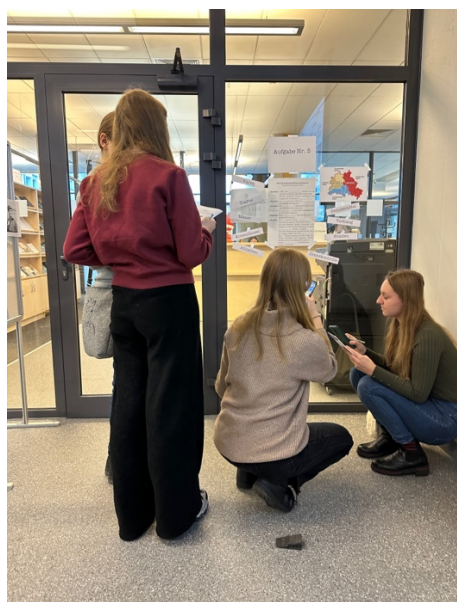
Aufgabe 6: Die Berliner Mauer hat Ost- und West-Berlin getrennt. Was ist vom Mauerbau bis zum Mauerfall passiert?