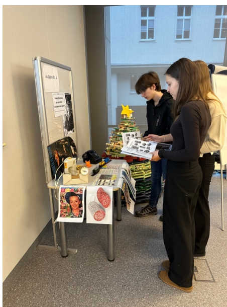
Aufgabe 5: Besatzungszonen und die Politik der DDR (Lückentext)