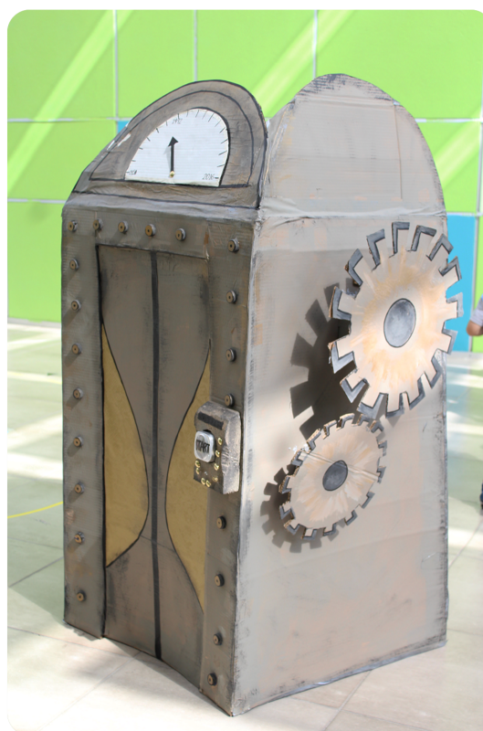
Zeitmaschine als Kabine