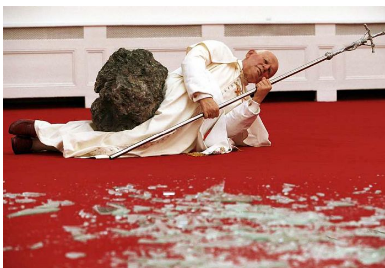
Maurizio Cattelan: „La Nona Ora“