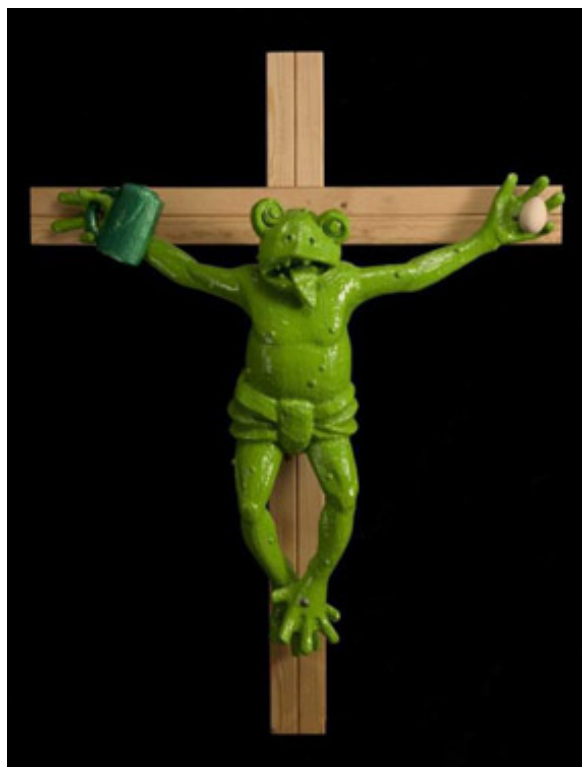
Martin Kippenberger: „Zuerst die Füße“

Passen die unten abgebildeten Werke in Deine Kunstvorstellung? Begründe Deine Meinung!