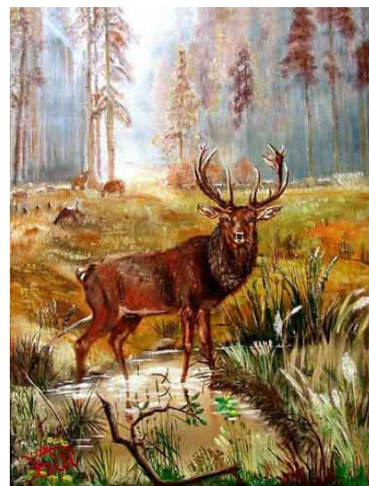
A.W. Kalti: „Hirsch auf Waldlichtung“